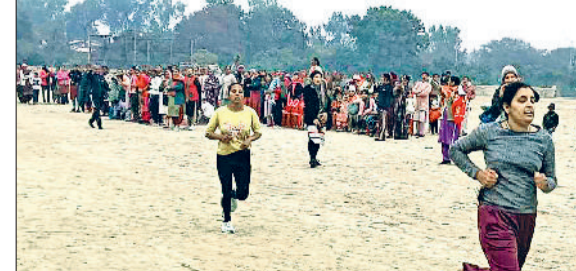
सिरसा। प्रतियोगिता में भाग लेती महिलाएं।