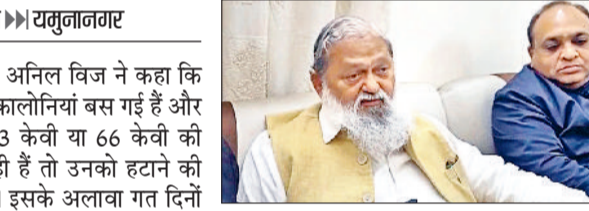
ऊर्जा मंत्री अनिल विज ने कहा कि प्रधानमंत्री नरेन्द्र मोदी का यह जीत का कारवां लगातार चलता ही जा रहा है और यह आगे भी चलता ही रहेगा। उन्होंने राहुल गांधी के प्रशिक्षण कार्यक्रम में आने को लेकर कहा कि राहुल गांधी यहाँ पर प्रशिक्षण देने आए हैं, लेकिन मैं यह कहना चाहता हूँ कि कांग्रेस नेता राहुल गांधी को जानकारी केवल चुनाव हरवाने की है। विदेशी तो कांग्रेस है और कांग्रेस का जन्म एक अंग्रेज अधिकारी 1885 में एओ हयूम ने किया था। अगर राहुल गांधी यह कहते हैं कि वह बाहर चले जाए तो तुम भी बाहर चले जाओगे और यहाँ पर केवल भाजपा का ही राज रहेगा।

हरियाणा के ऊर्जा मंत्री अनिल विज ने कहा कि प्रदेश के जिन क्षेत्रों में कालोनीय बस गई हैं और उनके ऊपर से यदि 33 केवी या 66 केवी की बिजली की तारें जा रही हैं तो उनको हटाने की कोशिश की जा रही है। इसके अलावा गत दिनों आई तेज हवाओं व बारिश के चलते उखड़े हुए खंभों व प्रभावित हुए फीडर व ट्रांसफार्मरों को ठीक किया जा रहा है। उन्होंने उक्त जानकारी की टीक खेल परिसर में आयोजित जिलास्तरीय गणतंत्र दिवस समारोह के बाद मीडिया से बातचीत करते हुए दी। ऊर्जा मंत्री अनिल विज ने कहा कि मकान के ऊपर से तार जाने के संबंध में यह देखा जाता है कि पहले तार डाली है या पहले मकान बना है। यदि मकान बाद में बना है तो तार हटवाने का एस्टीमेट जमा करवाना पड़ता है। विज ने कहा कि वैसे मैं कहीं पर भी बिजली को रूकने नहीं देता हूँ और इस संबंध में मैं खुद इसकी निगरानी रखता हूँ।