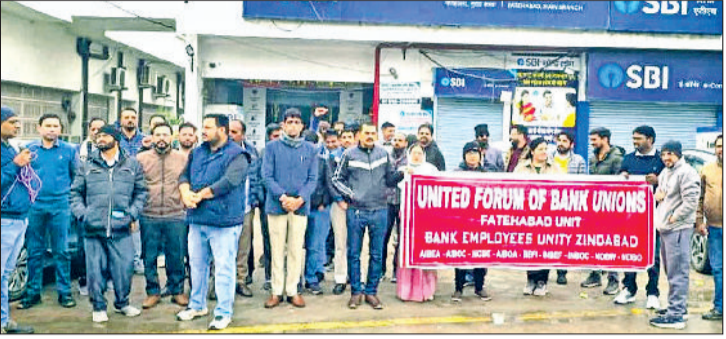
फतेहाबाद। एसबीआई के बाहर अपनी मांगों को लेकर प्रदर्शन करते बैंक कर्मचारी। टोहाना। बैंकों को लेकर प्रदर्शन करते बैंक कर्मचारी।